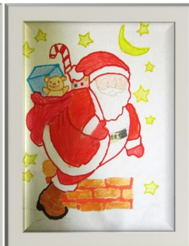
Wiktor Pizło klasa III