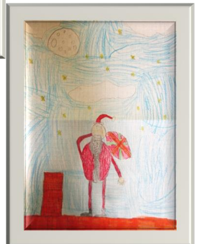
Wiktor Wojciechowski klasa III